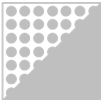
ORAFLEX® 11653 средняя