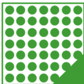
ORAFLEX® 11625 мягкая